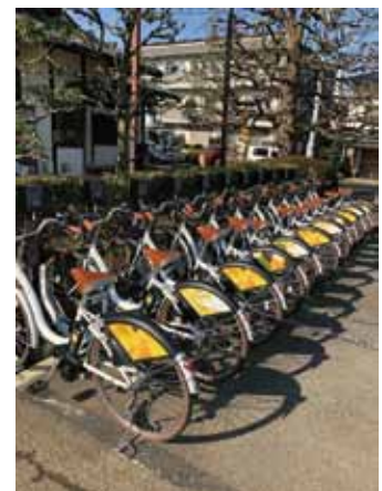
ドレスプレート PR 掲載イメージ